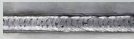
DUO Plus™ - Edelstahl

DUO Plus™ erhält optimal die Stärke des Stahls und gewährleistet eine WIG-ähnliche Schweißnaht.