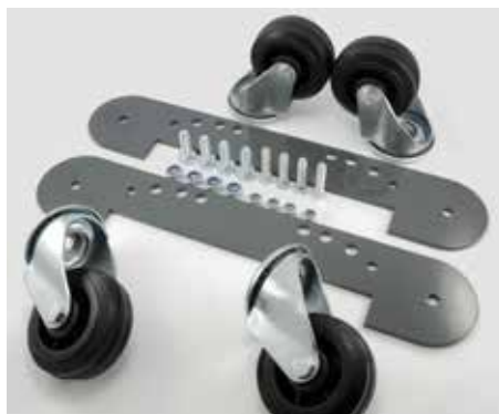
Radsatz zur Montage unter dem Schutzbügel (Artikel-Nr. 78861413)