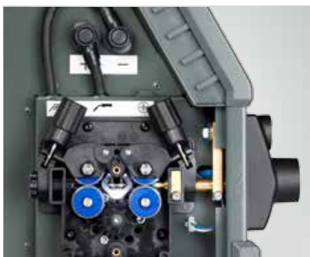
LED-Licht in der Drahtkonsole (Artikel-Nr. 78861545)