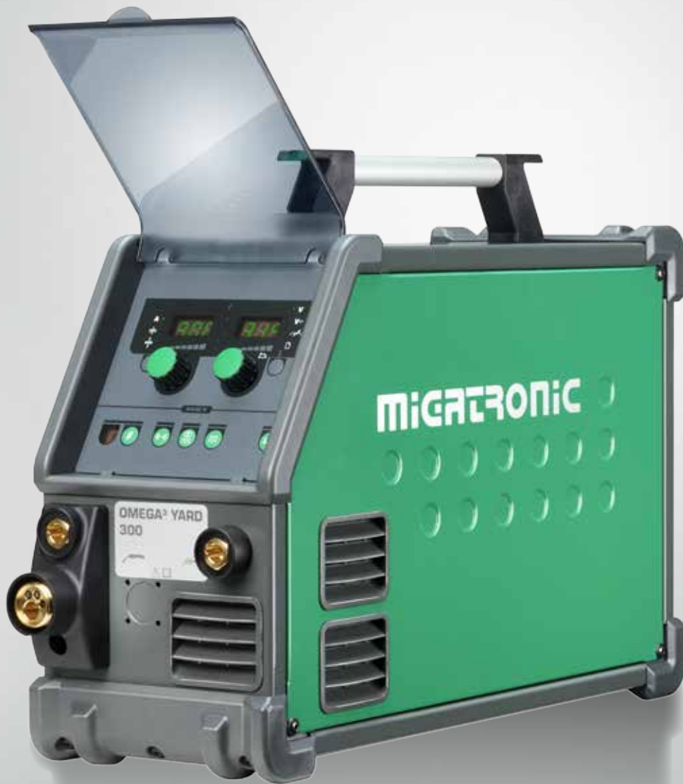
Abb. mit MMA Dinse-Kit (optionale Zusatzausrüstung).